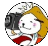
奥州胆沢劇場キャラクター みさごぞえもん